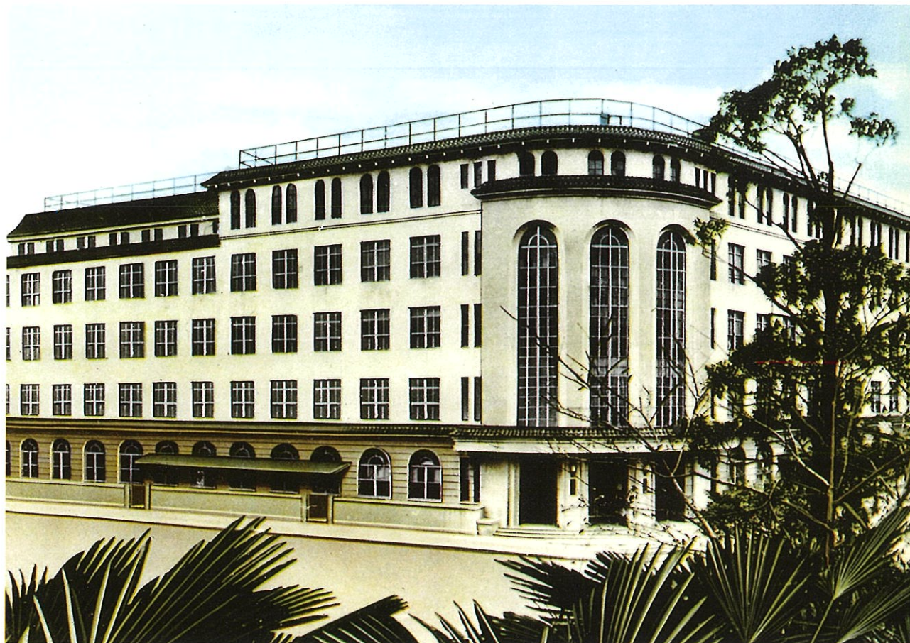
1936（昭和11）年6月15日に竣工した校舎。この校舎に使われた瓦をここで扱う。現在の、A・B・C・D棟。